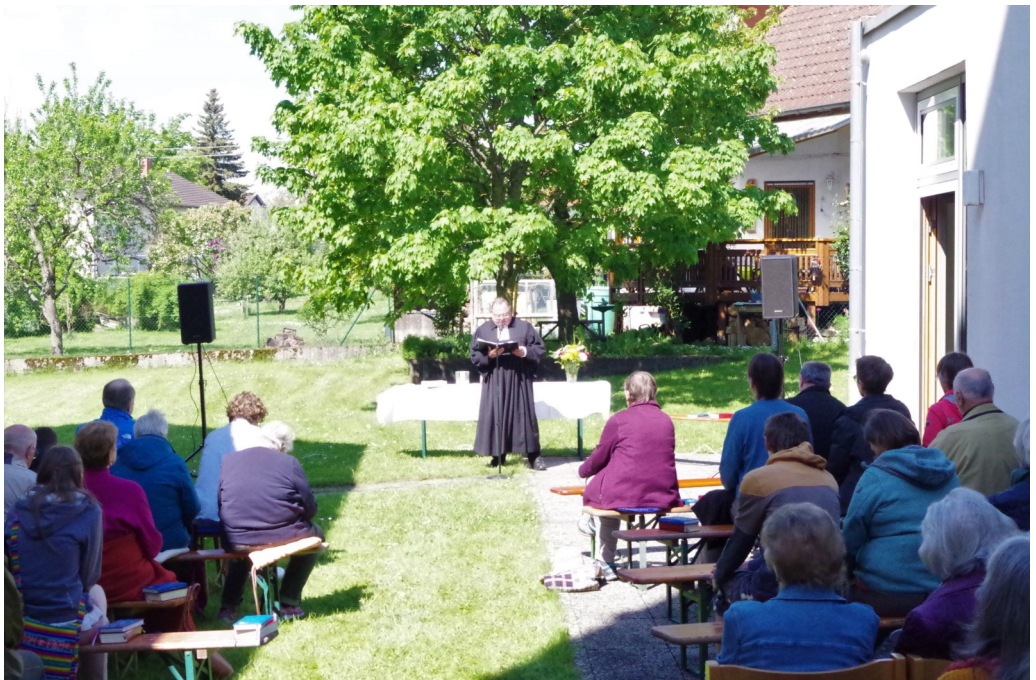
Himmelfahrtsgottesdienst im Grünen an der Kirche in Walldürn