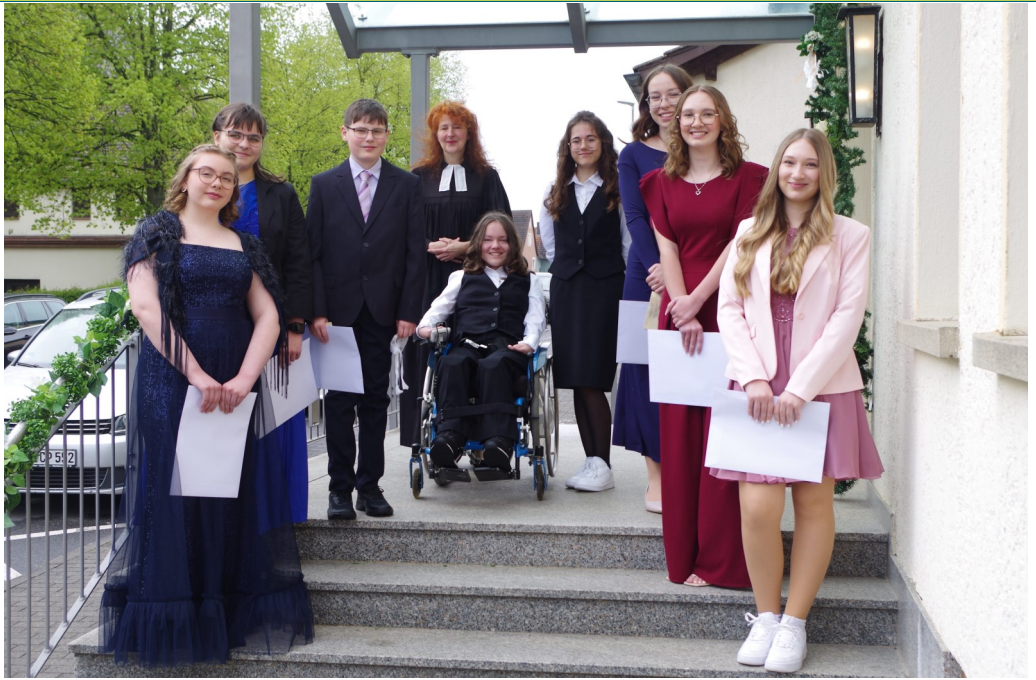
Konfirmation 21. April 2024